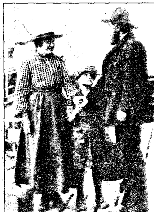
MARKENS GRØDE: Norsk, 1921