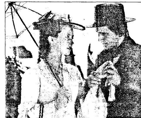
GÅTEN KNUT HAMSUN: Norsk, 1996