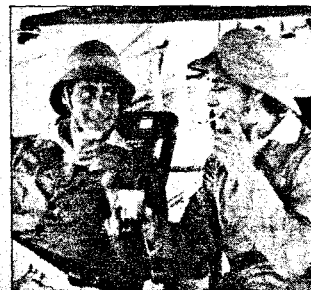
PAN: Fem akter og en epilog, norsk, 1922