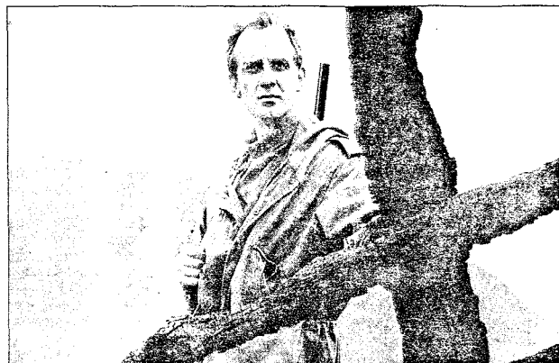
PAN: Kort er sommeren, svensk, 1962