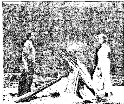
TELEGRAFISTEN: Norsk, 1993