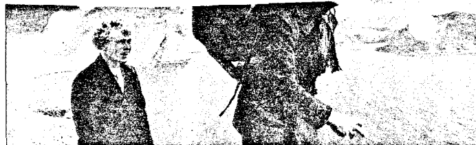
LANDSTRYKERE: Norsk, 1989