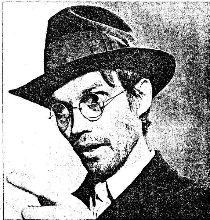
SULT: Nordisk filmperte fra 1966