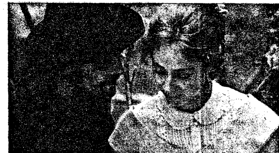
PAN: Norsk/dansk, 1995