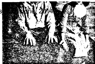
PAN: Løytnant Glahns skjebne, tysk, 1937

Tiltrukket blir filmskaperne altså, uansett de mange katastrofer Hamsun er en trollmann, også overfor illusjonistene i filmens verden.