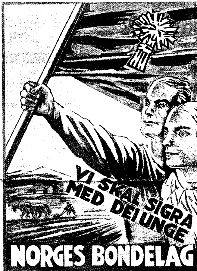
TIDSÅND: Disse to plakaten illustrerer tidsånden der et svært nasjonalromantisk syn på bondenæringen var felles for både Bondelaget og NS. (Illustrasjoner: Bondelagets historie bind 1/Hjemmefrontmuseet)