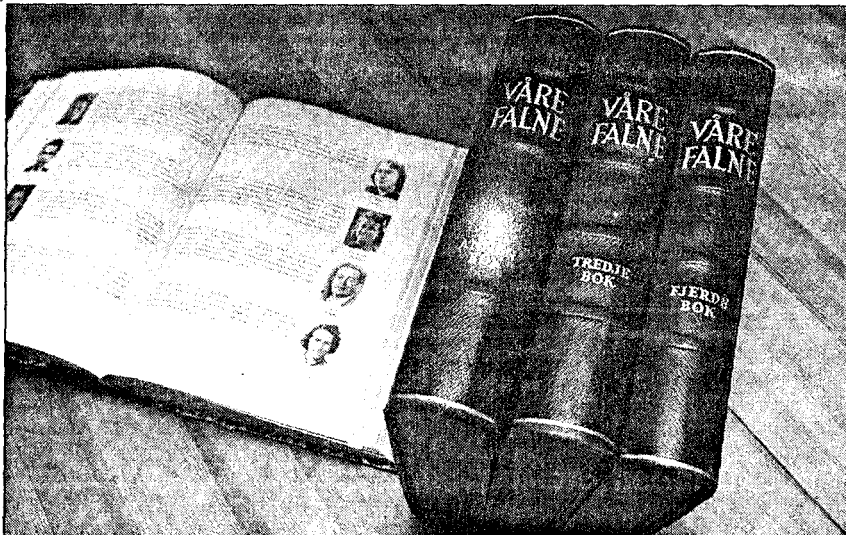
Nasjonalverket VÅRE FALNE i fire bind.