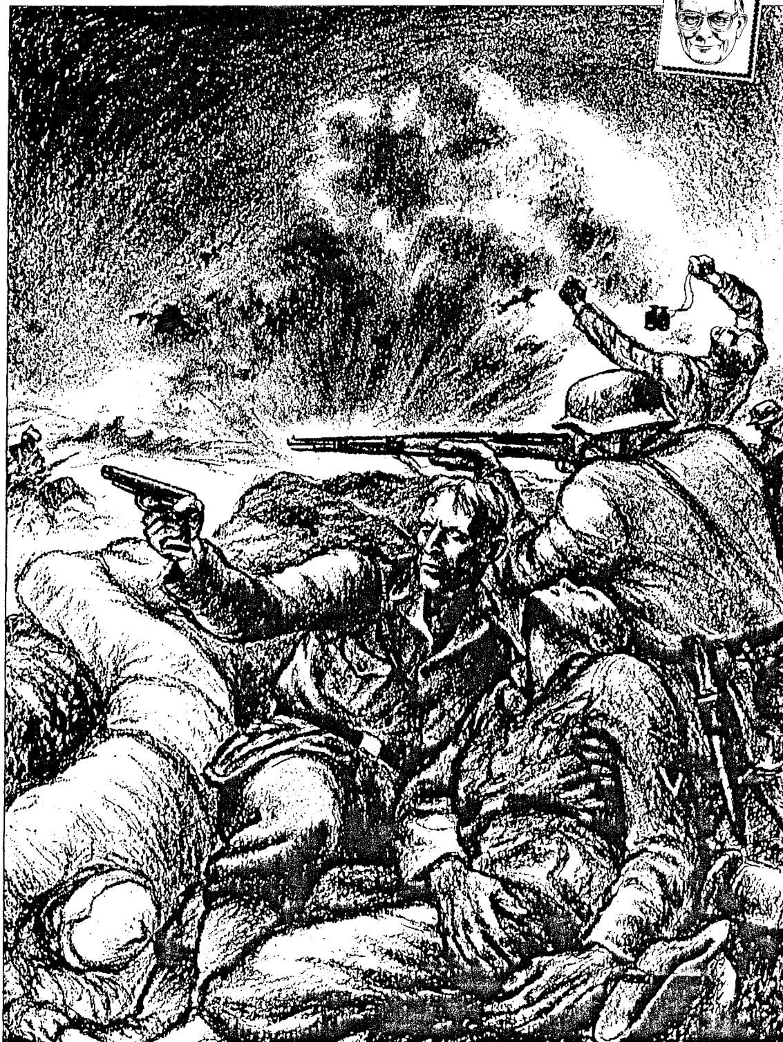
Krigens ansikt. (Tegning: Finn Wigforss, Institutt for Norsk Okkupasjonshistorie)

givende: "Norges skjebne blir avgjort under stålhelmen. Tysklands kamp er Norges kamp. Tysklands seier er Norges seier!"