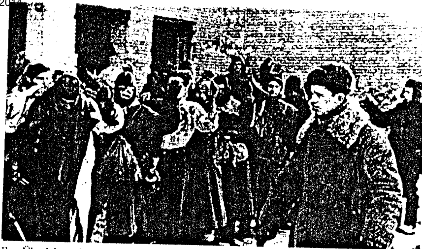
Ihre Überlebenschancen schwankten zwischen 5 Prozent (1941/42) und 50 Prozent (1945). Deutsche Kriegsgefangene in sowjetischer Hand.

Ein Teil der Auflage erscheint unter dem Titel »Die neue Feuerwehr« mit der ständigen Rubrik »Aus der GD-Familie«.