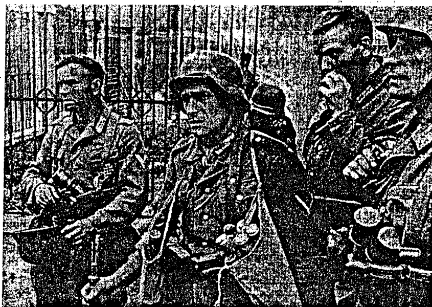
Gekämpft, um ihrem Volk das Äußerste zu ersparen: Deutsche Infanteristen

Inwieweit Hitler einen großen Krieg anstrebte, ist durchaus umstritten. In seinen authentischen Reden vor der Wehrmachtsführung im Jahre 1939 (es sind gefälschte Versionen in Umlauf) argumen-