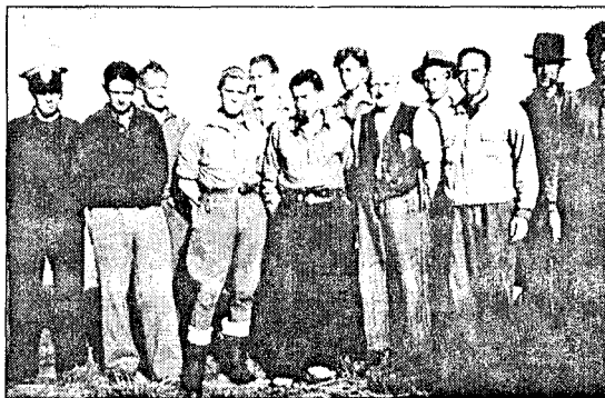
Straffanger, med vakt til venstre.

ning skulle man da i desto høyere grad kunne forlange at hun innså hva NS og tyskernes virksomhet her i landet innebar. Hun hadde i presse og kringkasting offentliggjort en rekke artikler og foredrag, hovedsaklig om sosiale emner, men med tydelig propagandistisk og NS-ideologisk tendens.