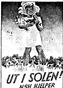
Nasjonal Samlings Hjelpeorganisasjon drev blant annet feriekolonier. (Tegner: Ukjent. Institutt for Norsk Okkupasjonshistorie)

For dette ble han dømt til 6 års tvangsarbeid, rettighetstap i 10 år og offentlig stilling.