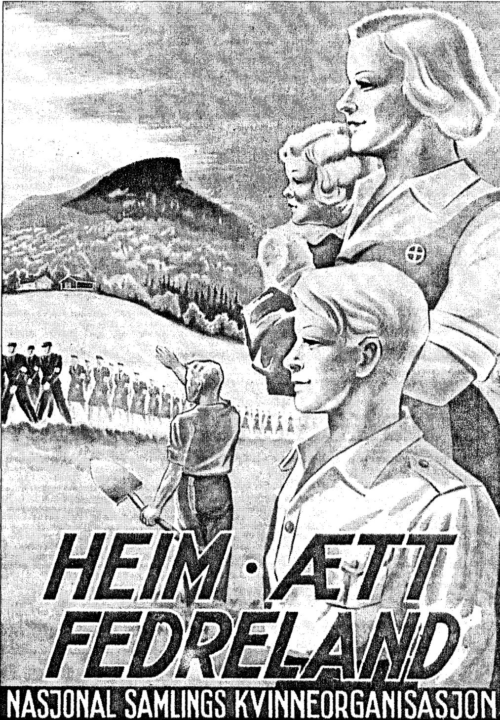
(Tegning: Kaare Særum, Institutt for Norsk Okkupasjons-historie)

Fra flere rettsreferater i Østlandets Blad mot aktive NS-medlemmer: En husmor med 3 voksne barn stod tiltalt for Follo herredsrett for medlemskap i NS.