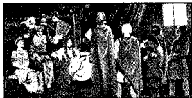
SPENNENDE FORTELLING om kong Sigurds eventyrlige ferd til Jorsalaland.