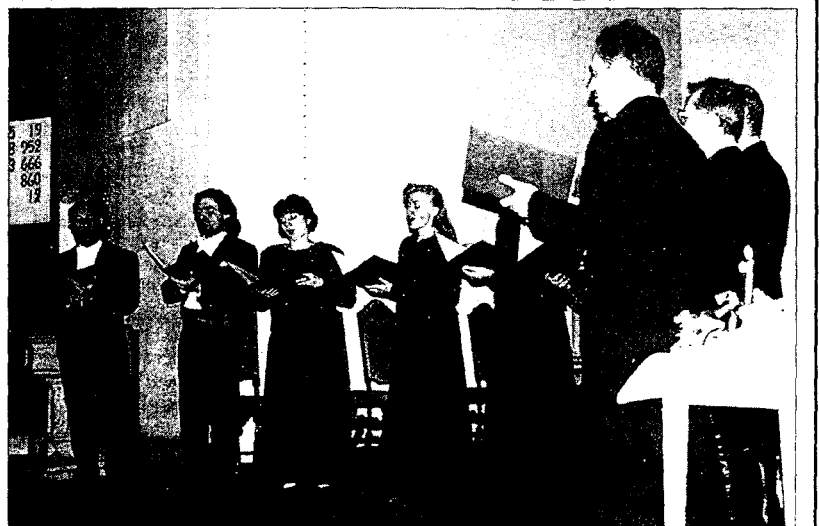
KIRKEKONSERT: Russisk klassisk musikk ble vakkert fremført i går kveld av berømte Moscow Ensemble of Classical Music.

Repertoaret er basert på et grunnlag av andefighet, hvor tyngdepunkt er hentet fra den synodiske skole i russisk koral-sang.