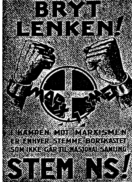
93 000 norske borgarar var mistenkte for å ha støtta syn som dette.

hadde anna på rulleblada sine enn sjølve parti-medlemskapen, blei straffa med bøter. Passive NS-medlemmer fekk oftast saka si avgjord ved førelegg, ikkje gjennom ei rettsak. Til saman 17 000 av alle dei mistenkte fekk fengselsstraffer under rettsoppgjeret. Den siste livstidsfangen, NS-ministeren Axel Stang, blei sett fri i 1957. Men det norske samfunnet var enno ikkje ferdig med landssvikarane: Oppgjeret kasta lange skuggar inn i etterkrigstida, og nokre av skuggane strekkjer seg heilt inn i vår tid.