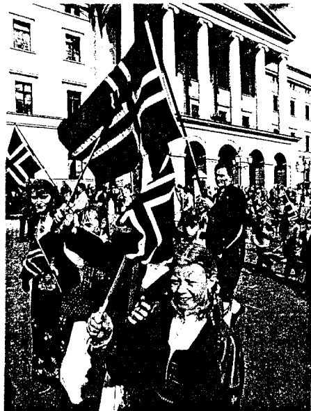
94 prosent av oss feirar 17.mai. Har vi sterkare nasjonal-kjensle enn andre?(NTB)

massivt opp om nasjonale ritual: 94 prosent tek til dømes del i feiringa av syttande mai. Ein kan spørje seg om nordmenn etter krigen kanskje til og med har fått ei sterkare nasjonal-kjensle enn det ein finn i dei fleste andre europeiske landa? Nokre vil meine at nei-fleirtalet i Noregs to avstemmingar om EU-medlemskap er eitt teikn på at så er tilfelle.