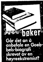
Gør det an å anbefale en Goebbels-biografi skrevet av en høyreekstremist?

Her får han full støtte av faglige kolleger. De er alle rustet over Hans Fredrik Dahls standpunkt.