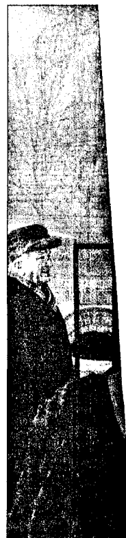
FORTIDEN: Tidligere fanleiren Auschwitz. Sammenhengene av å «føre krig»

Affæren med det jødiske gullet synes å ha skapt en grunnleggende endring i amerikanernes bilde av Sveits og dets rolle under den annen verdenskrig, på samme måte som Waldheim-skandalen ti år tidligere skadet bildet av Østerrike. På grunn av Waldheim ble oppfatningen av Østerrike på kort tid endret,