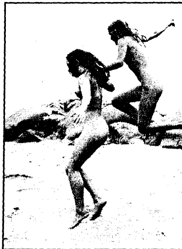
NATURISTER: Må kropper være så perfekte uten klær for ikke å vekke avsky?

Kunne man som et kompromiss av hensyn til de middelaldrende, styrende