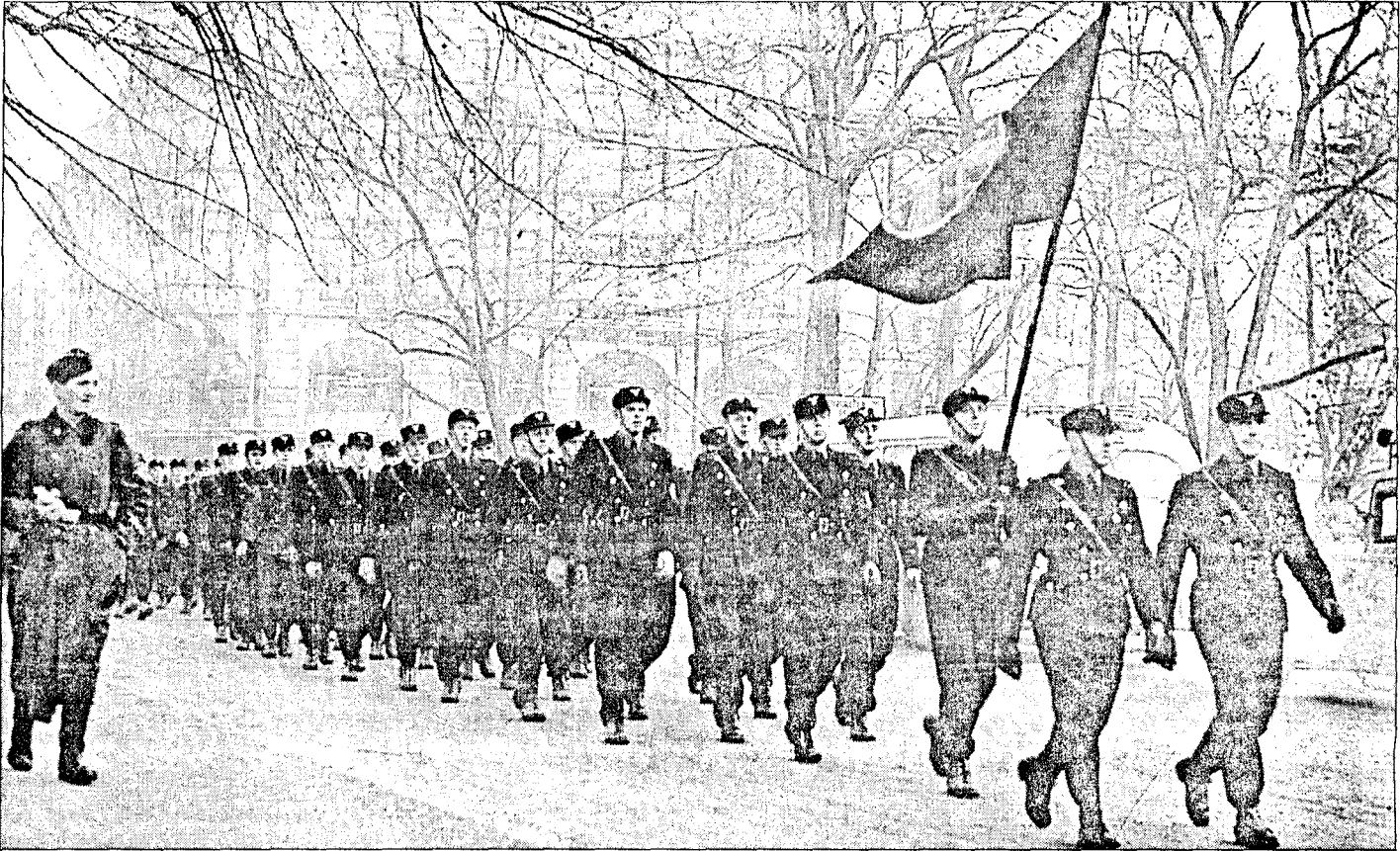
I Universitetsgaten 1. november 1941. Eidsvolds plass til høyre, Karl Johan på tvers bak.

Hirden var den delen av partiet som NS selv vurderte høyest, og som fikk de største ressursene. Den var uniformert, men ubevæpnet. I krigens siste år dannet den likevel hovedstammen innen de væpnede NS-enhetene som ble opprettet, Hirdens Bedriftsvern og Hirdens Alarmen-