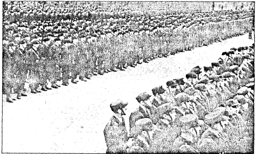
Fra monstringen på Universitetsplassen.

På spørsmål fra en av forsvarerne om den bemerkning mannen en gang hadde kommet med - at guttene etter krigen skulle fåes o.s.v. - forklarte mannen at dette hadde han ikke sagt. Guttene hadde vært etter ham før, og han kunne nok ha kommet med en bemerkning om nazistene i sin alminnelighet og om