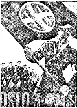
Hirden marsjerte i Oslo i 1941. Denne plakaten fra mai ble brukt også i november, men med nye datoer påført. (Tegning: Kaare Sarum, Institutt for Norsk Okkupasjonshistorie)

Den eldre mannen løp så bortover veien, og Pål satte etter ham. Han dyttet så til mannen, husker ikke om denne falt overende og - han syntes nesten det var en skam å si det - men stod ikke mannen der og gråt! Hvor-