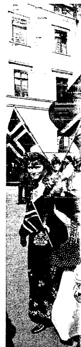
Syn og Segn 1/1997

massivt opp o til dømes del f spørje seg om og med har fãt det ein finn i Nokre vil meir avstemmingar på at så er tilf