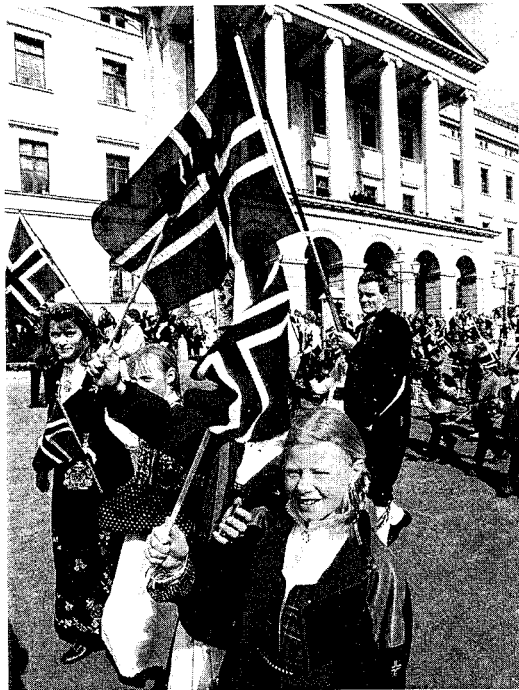
94 prosent av oss feirar 17.mai. Har vi sterkare nasjonalkjensle enn andre?

massivt opp om nasjonale ritual: 94 prosent tek til dømes del i feiringa av syttande mai. Ein kan spørje seg om nordmenn etter krigen kanskje til og med har fått ei sterkare nasjonalkjensle enn det ein finn i dei fleste andre europeiske landa? Nokre vil meine at nei-fleirtalet i Noregs to avstemmingar om EU-medlemskap er eitt teikn på at så er tilfelle. 7