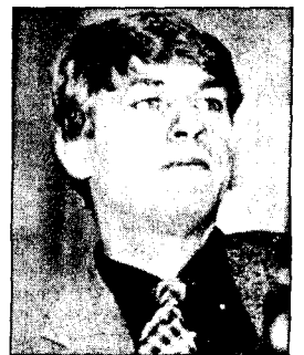
Hans Fredrik Dahl: Jeg har tenkt mye på om jeg gjorde et feilgrep.

zistiske barbari og den vanvittige mordpolitikk som Sovjetstaten bedrev.