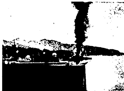
Den tyske krysser Königsberg ble som kjent senket på Bergens havn i 1940. Skipet ble stukket i brann av britiske fly og sank etter en tids forløp. Bildet vårt viser skipet mens det brenner og eksplosjon på eksplosjon inntrerffer.

Fra en av disse flyktninger, en tysker som vi en tid sto i kontakt med etter hans ankomst til Sverige, fikk vi nylig et brev hvor han bl. a. skriver: «Som politisk flyktning delar jag glädjen över Norges befrielse med Er. Detta i synnerhet eftersom