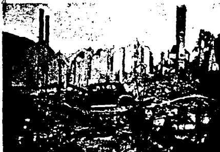
Den totale krig betyd total utsekkelse. Omgitt av ruiner på alle kanter står bilen i midten, — den later til at den har sluppet forholdsvis heldig fra angrepet. Bildet er fra en norsk bil som tyskerne lot det regne med bomber over i 1940.