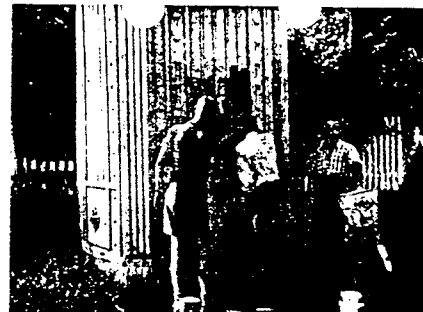
Gutter er kommandert ut av N.S. til å vaske av H 7-merker.

Sommeren 1943 hadde tyskerne planer oppe om å bygge bru over Mjøsa fra Gjøvik til Nes. A transportere tropper over Mjøsa på ferja gikk for smått for herrefolket, så en bru måtte komme. Heldigvis ble det ikke noe av dette byggverk heller. Mjøsa kunde for øvrig brukes til litt av hvert, bl. a. til anlegg av en flyplass, og det var tyskernes alvorlige mening å lage en flyplass på veldige flåter. Materialer til disse flåter skulde naturligvis tas fra den norske skog, og det vilde ikke ha dreid seg om små kvanta materialer i dette tilfelle. Før tyskerne hadde foretatt seg noe mere enn planleggingen av dette kjempeprosjekt, var interessen for det dalet og et nytt fantastisk prosjekt et annet sted kommet i forgrunnen. Nei, herrefolket var ikke småkårne!