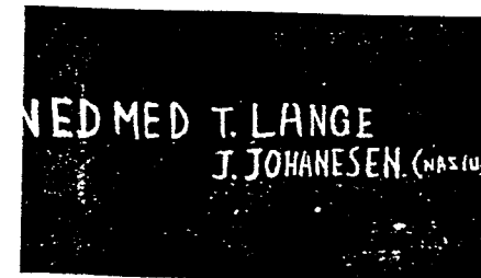
Det er malt på veggen på Gjøvik skole.