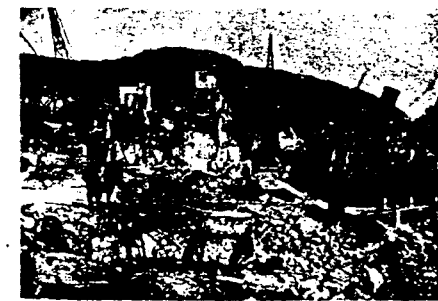
Et par illustrerende bilder fra krigen i Norge. Til venstre ser vi Narvik by i brann etter det tyske bombardement. Til høyre et bilde fra havnen etterat tyske fly hadde herjet.