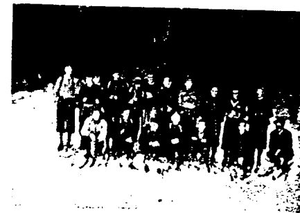
En gruppe deltagere i skirenn på Reinli vinteren 1943.