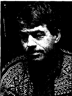
HANS FREDRIK DAHL: Angripes fordi han hevder at David Irving er en fremragende kildekritiker.

Dagbladet, 25. juni 1996 «Men nå er altså stuerenhet opphøyd til kriterium i den toneangivende amerikanske offentlighet, også når det gjelder et vitenskapelig arbeid fra den fremste kildekritiker innen nazismens historie i dag. Det tyder ikke godt for fremtiden.» Dagbladet, 25. juni 1996