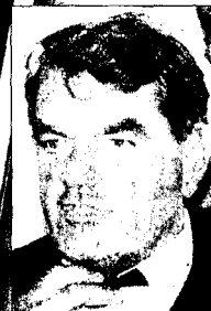
RYDDIG? David Irving (bildet) har stadig tydeligere avslørt nazistiske sympatier, men ifølge Hans Fredrik Dahl forhindrer ikke det at han kan opptre ryddig som historiker og skrive gode bøker.