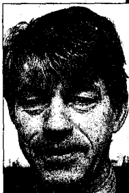
FORSVARER: Hans Fredrik Dahl mener at David Irving, til tross for klare nazistiske sympatier, kan opptre som en ryddig historiker.

Under en retts sak i Canada i 1988 ble Leuchter avslørt som alt annet enn ekspert, og hans prøver var tatt fra vegger som var rekonstruksjoner og ikke stammet fra krigstiden. Ikke desto mindre går Irving, i et forord datert mai 1989, god for Leuchters undersøkelse, metoder og konklusjon og sier til