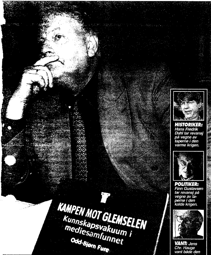
høyre) målberer i sin pamflett mot historikeren Hans Fredrik Dahl. Her er