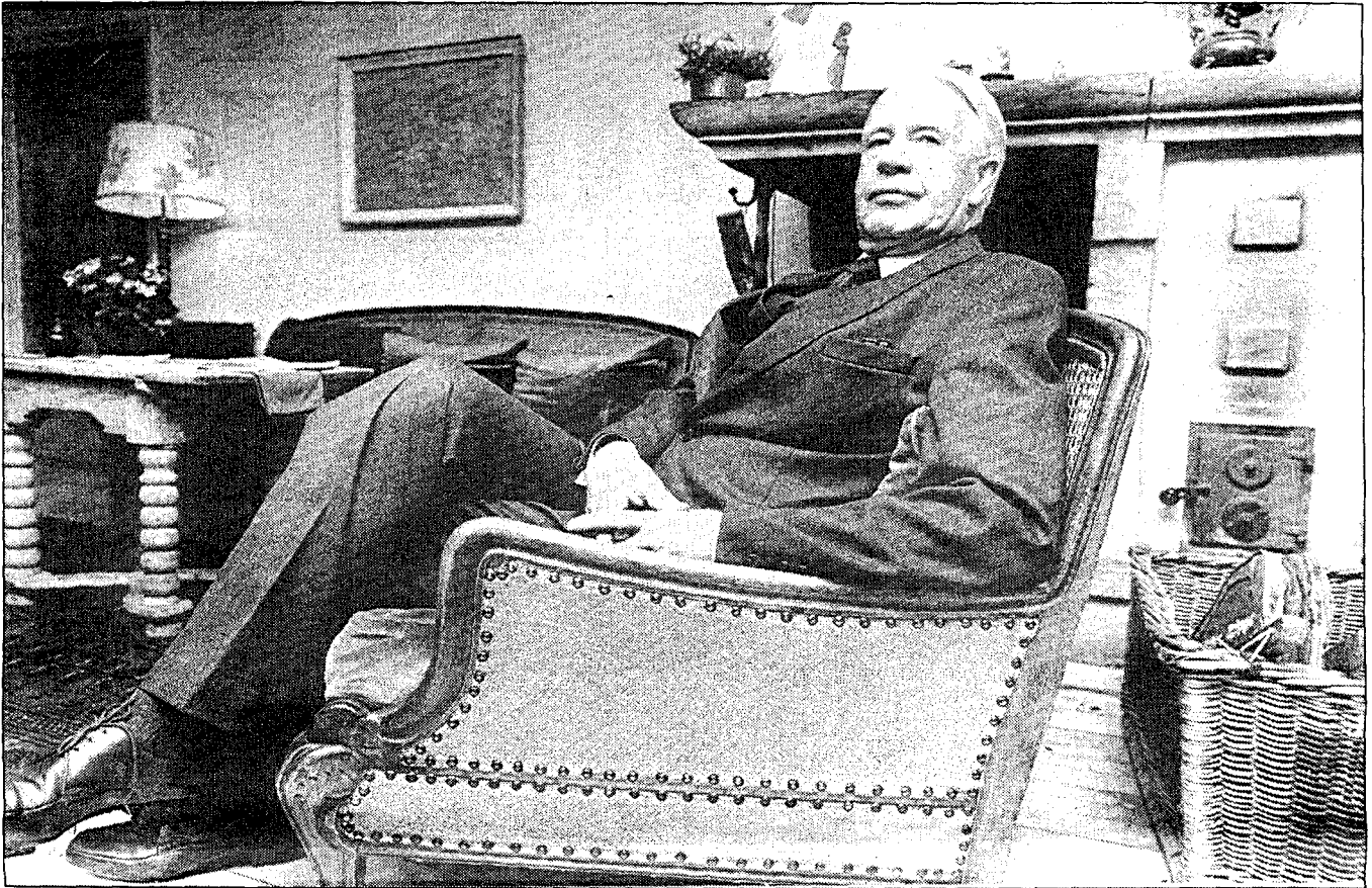
STÅR FRAM: Olaf Lindvik er dømt for landssvik. Nå forteller han hvorfor han gikk inn i Hitlers tjeneste, og ble en av de mest sentrale nordmenn på tysk side.