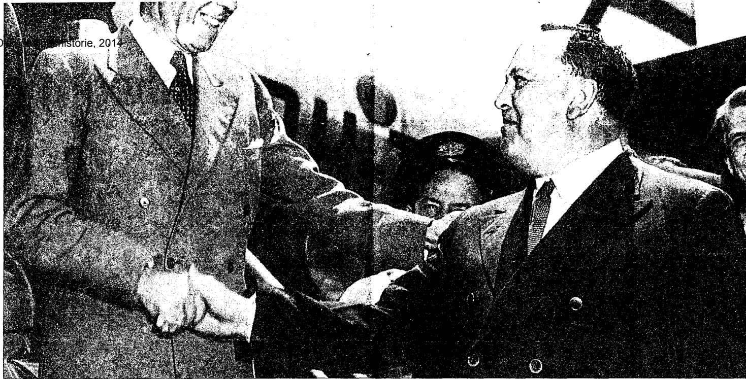
HJERTELIG FASADE: Ifølge Odd Karsten Tveit motarbeidet Trygve Lie (t.h.) i all hemmelighet FNs egen spesialutsending til Midtøsten, svensken Folke Bernadotte (t.v.), ved å informere israelerne om Bernadottes interne rapporter.

Palestinerne skal etterhvert ha blitt så frustrert over Lies virksomhet at de planla å myrde ham da han for første gang besøkte