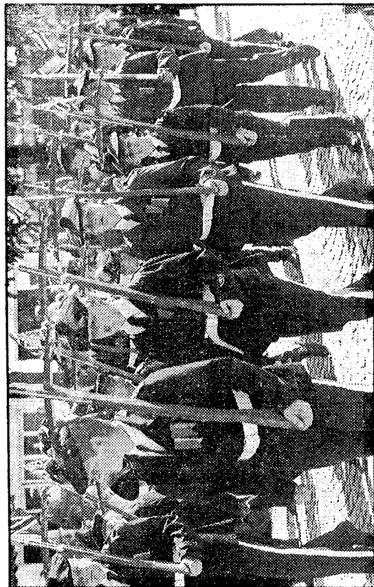
Skansens Bataljon på marsj. De feirer attpåtil 130 år 22. mai, men feiringen skal skje allerede i morgen.