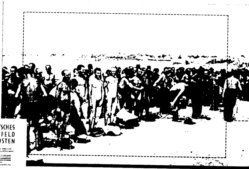
DEUTSCHES VORFELD IM OSTEN

Autor Klee sah Hinrichtungsoffer der SS, Historiker Heer eine Exekution durch die Wehrmacht