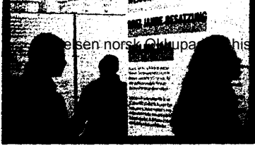
DIE AUSSTELLUNG verlegt die Bildszene aus dem Generalgouvernement Polen nach Weißrußland