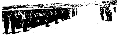
Wahrscheinlich zum ersten Male in ihrem Leben ist diese Gruppe deutscher Soldaten zum Boden eingetaucht und hat man sieht schreit der Mann und nicht ohne schreie bekommen zu sein.

Heer aber trieb Klees Fälschung noch weiter. Der Journalist hatte das Propagandabild in den Zusammenhang mit der Ermordung von Juden durch SS-Einsatzkommandos im Osten gestellt. Der Historiker dagegen machte es, unbelastet jeglicher Nachforschung, zu einem weiteren Beleg für Verbrechen