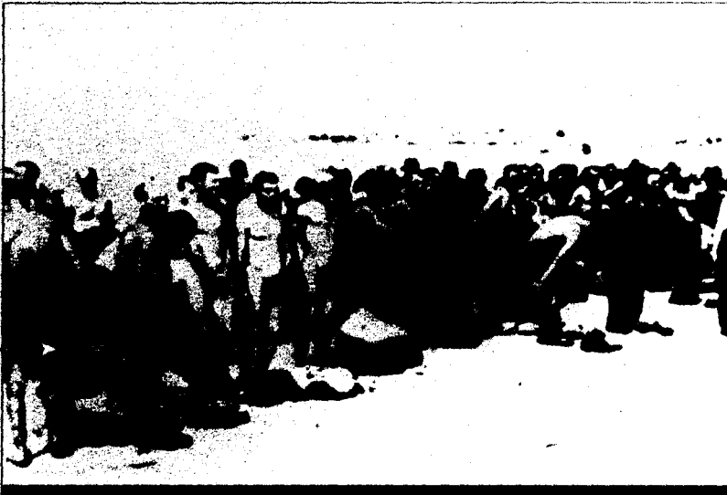
1997: Die Wehrmachtsausstellung zeigt diesen Ausschnitt mit der Erklärung „Juden werden exekutiert“ als Beleg in dem Ausstellungsabschnitt „Wehrmacht und Holocaust“