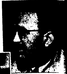
CSU-POLITIKER Peter Gauweiler distanziert sich vom NS-Buch seines Onkels