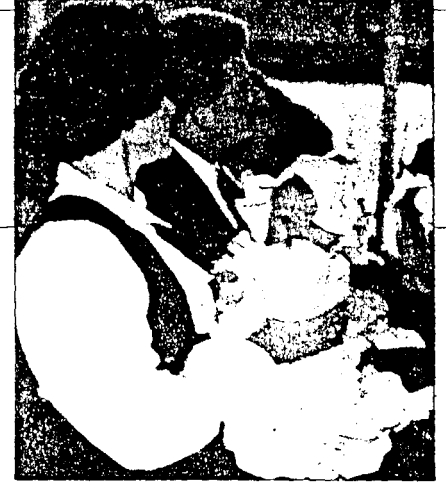
SPENNENDE: Kledd i sin fineste stas ble 15 småbarn båret til dåpen i Brumunddal kirke søndag. Ikke alle fikk med seg all hva presten sa, for det skjedde så mye spennende på sidelinjen også...