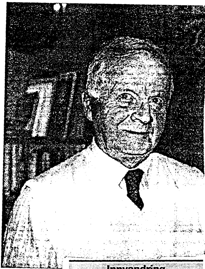
INNELEDER: Pensjonert ga. – Jeg er ingen nasjon

– Jo, fordi jeg er imot dagens innvandringspolitikk. Vi har flere pa-