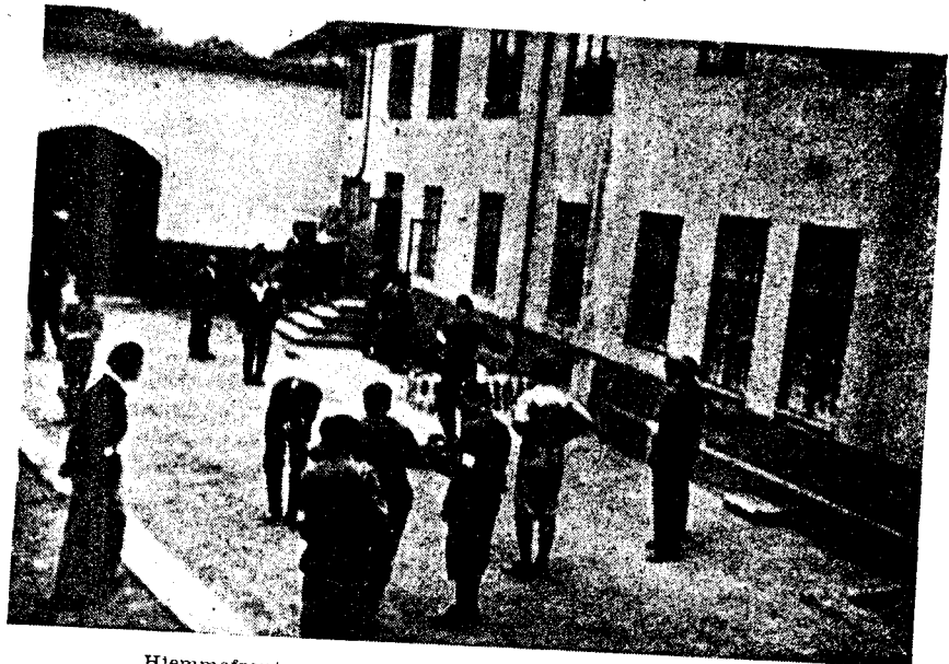
Hjemmefrontmann tramper på en varetektsfanges rygg.