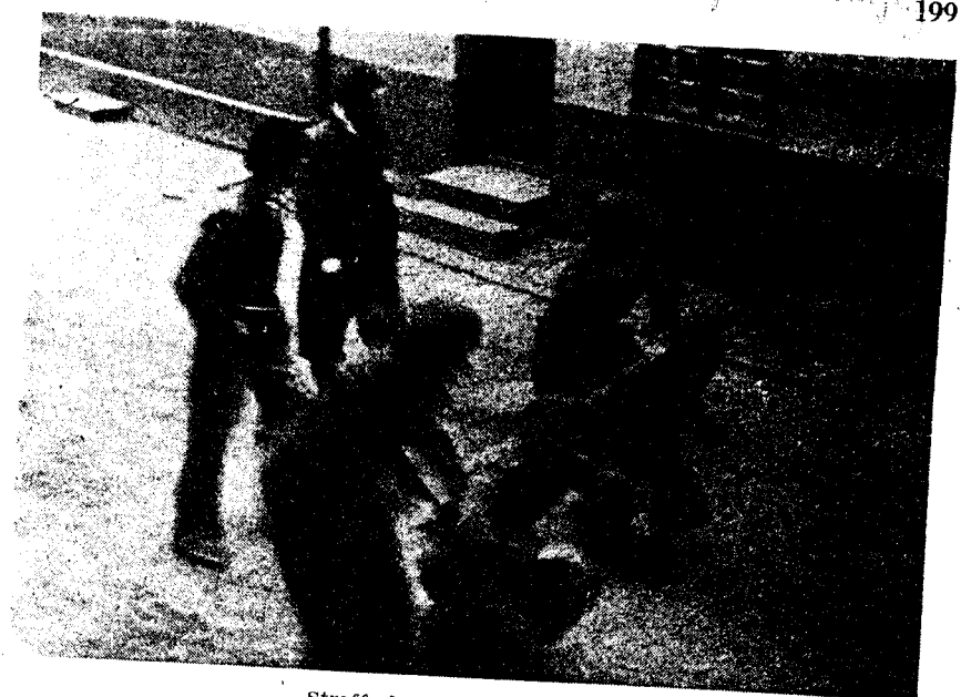
Straffeeksersis på Akershus.

om de direktiver dobbelbunn». 0 -- selv under dmyge «bistand