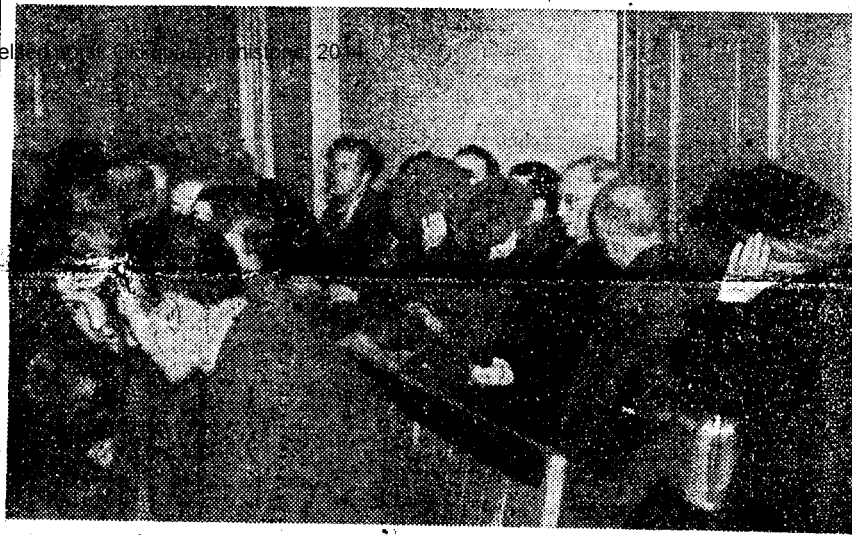
Et utsnitt av tilhørerplassene. Som man ser er det noen som ikke liker å bli fotografert.