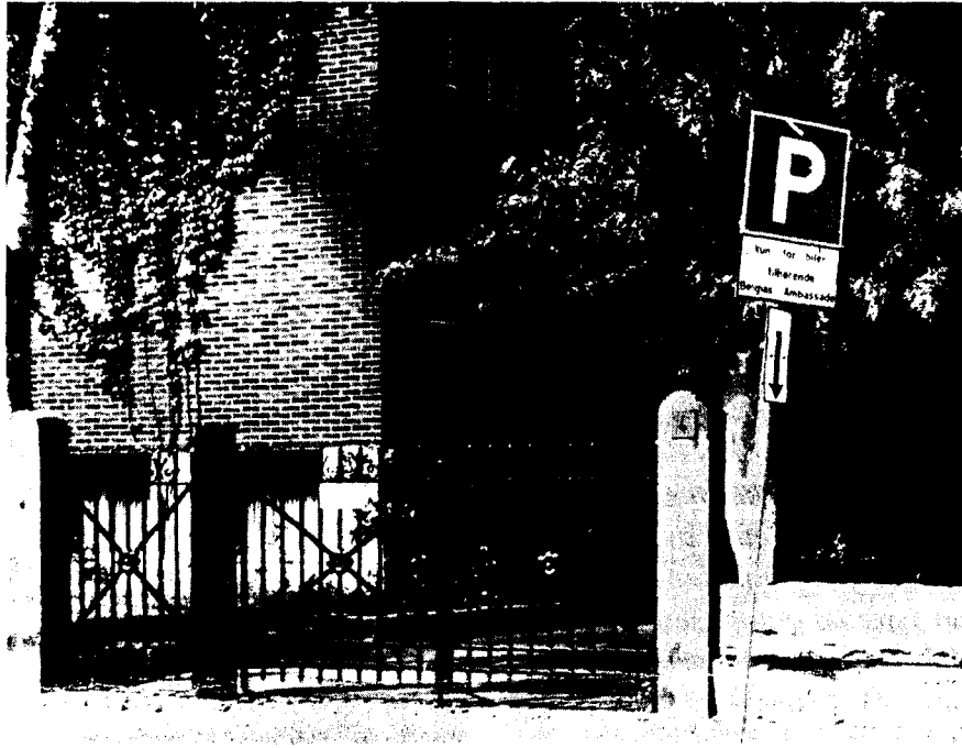
Alfa Bibliotek, INOs nye lokaler på Frogner

de tidligere holdt til på Enerhaugen, et boligområde på Oslos østkant, har de nå