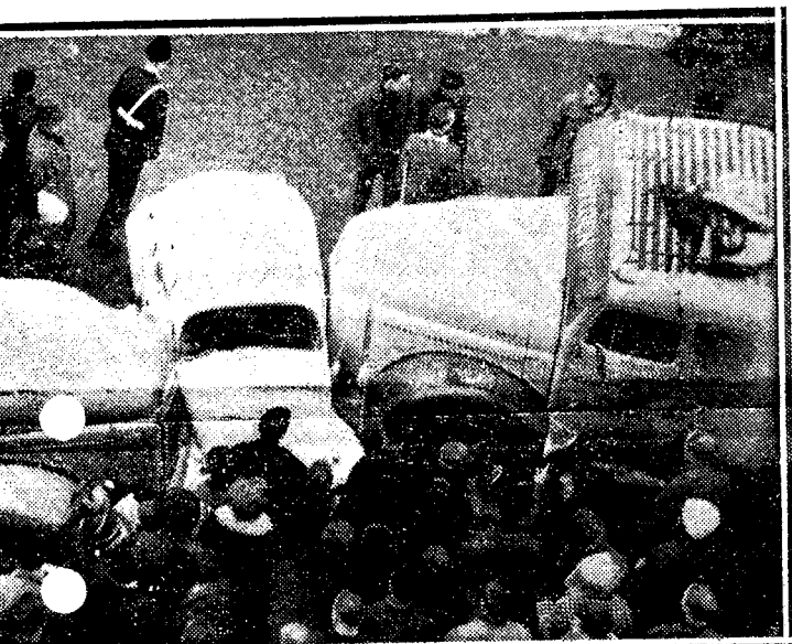
A at den unge sjåføren i denne Volkswagen følte seg litt nedtrykt. Trafikken utenfor Telegrafbygningen i Universitetsgaten. Etter hva vitene lastebilen å skli nedover mot de to andre bilene unge sjåføren forsøkte fortvilet å kjøre sin bil unna «forfølgeren» men lastebil-frontene. Hans mor stod utenfor bilen og ventet til sønnen — uskadet men ikke særlig høy i hatten.

Gi Dem selv et nyttårslofte som er lett å holde: Loy Dem