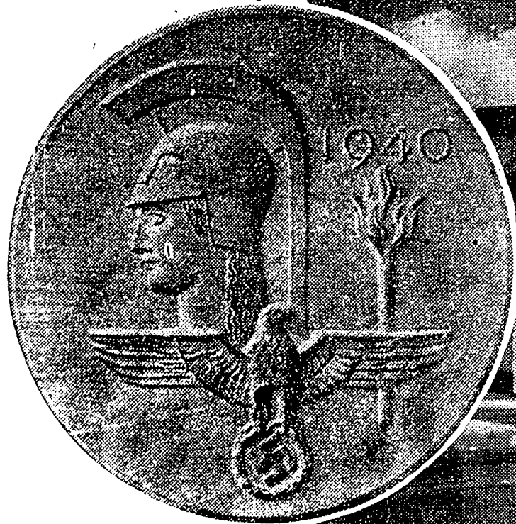
Medaljongen til den store tyske kunstutstilling 1940.