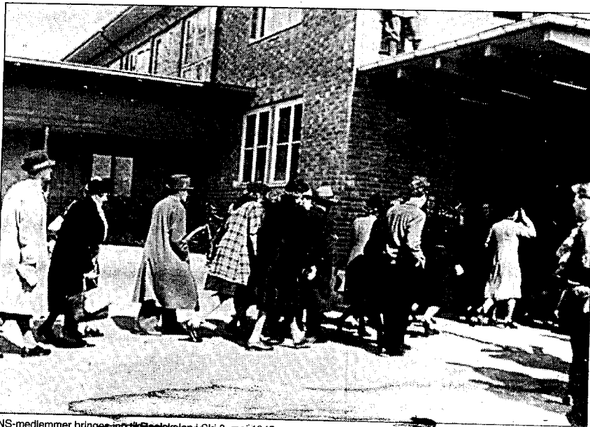
NS-medlemmer bringes inn til Realskolen i Ski 8. mai 1945.

Ved at alt dette er samlet i den samme sekk og under den felles betegnelsen "landssvikere", har stort og smått fått et ytterst uheldig fellespreg, og der er skapt en kunstig solidaritet mellom alle som er dømt, skjönt det jo dreier seg om mennesker som på ingen