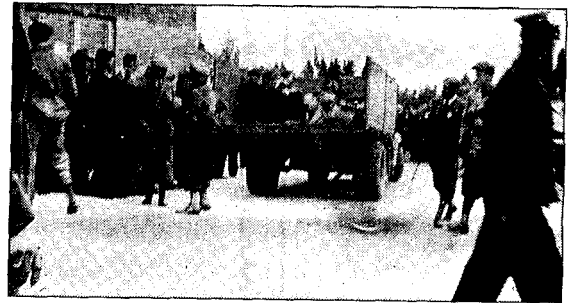
Den tunge veien videre.

Ikke alle kom på et lasteplan. Noen kom på motorsykkel. Noen f. En og en ble de hentet - og brakt opp til mengden. Disse ble det lagt merke til. Alene satt de der bak føreren. Jøssingen og nasisten. Da kom hun. Moren til en av klassekameratene våre kom. Vi stod sammen med ham - sønnen hennes. Han hadde en mor som alle visste var sammen med tyskerne. Han hånet også tyskerne. Og så kom hun. Liten og forskremt satt hun der bak på motorsykkelen. Hentet for å klippes - hentet for å hånnes. Da så han henne. Da så vi henne. Da så vi på henne og på ham. En mor og en sønn. Han i mengden - hun alene. Hun var hentet til mengden. Vi og han var en del av mengden. Vi så på ham. På ham som visnet ned. På ham