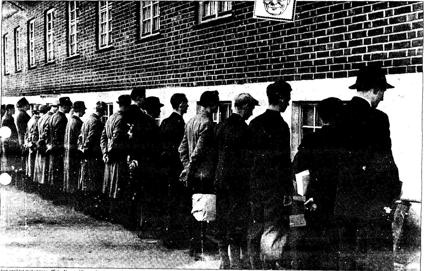
Med ansiklet mot veggen.

gesamten norwegischen Streitkräfte i kapitulasjonsavtalen av 10. juni 1940. Det sentrale ville ikke lenger ha vært om Norge som stat fortsatt var i krig eller ikke. Det sentrale ville ha vært at NS som parti - mot folkets vilje og med støtte av okkupasjonsmakten - hadde søkt å erstatte demokratiet med førerstaten.