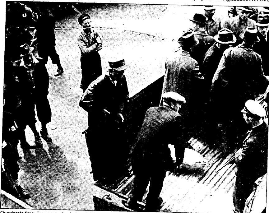
Oppjørets time. Fra arrestasjonsbøigen i Follo 8. mai 1945.

Ved å legge § 98 til grunn ville man ha unngått den bitre strid som har fulgt om forståelsen av uttrykket die