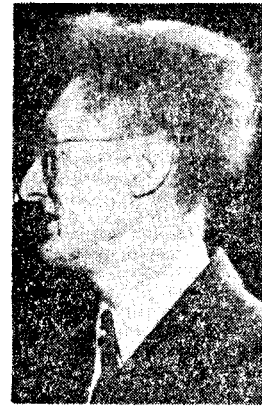
Mohr & Co.