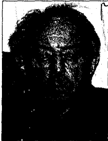
ARVTAGEREN: Stasi-sjef Erich Mielke utnyttet på kynisk vis de norsk-tyske barna som av ulike årsaker havnet bak Jernteppet i etterkrigsårene.