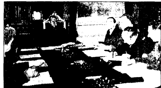
Vidkun Quisling leder sitt første statsråd på slottet 5. februar 1942. Lengst til h. sitter propagandaminister Gulbrand Lunde, fotografen bak de 55 år gamle opptakene som nå er funnet.