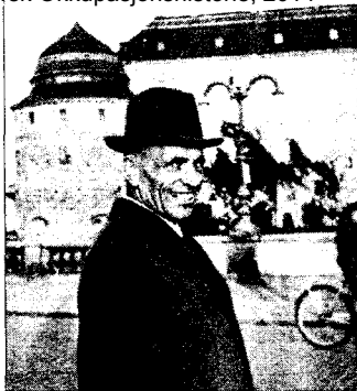
BREVSKRIVER: Martin Tranmæl i Stockholm under krigen. Arbeiderbevegelsens sterke mann brevvekslet mye med statsminister Nygaardsvold i London.

Det meste av arkivmaterialet er fra krigsårene. En vesentlig del består av korrespondanse mellom Nygaardsvold og sentrale norske aktører, som bl.a. Tranmæl, C.J. Hambro, Trygve Lie og