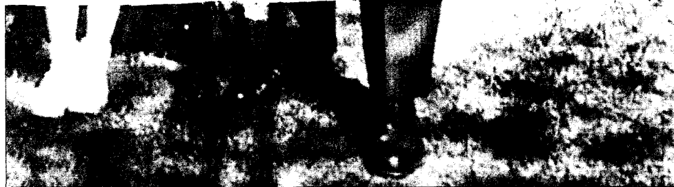
EN HÅND Å HOLDE I: Statsminister Johan Nygaardsvold med sigar i den ene og nåværende kong Harald av Norge i den andre hånden under et USA-besøk under krigen. Bildet finnes i et privat fotoalbum, som Nygaardsvolds familie nylig har gitt fra seg.

«Innerst inne forakter de Norge, nordmennene og alt hva norsk er. Og så skulle vi begynne å interessere oss for ny samrøring med det. Nei! Vi behøver ikke gå rundt og snakke om full frihet og selvstendighet for vårt land, hvis vi samtidig skal begynne å tigge om å få et nytt hundebånd på oss», skrev Nygaardsvold til Tranmæl.