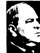
I USA: Stortingspresident C.J. Hambro (h)

En misfornøyd stortingspresident C.J. Hambro i USA anbefalte statsminister Nygaardsvold i London «å eksplodere» mer av hensyn til helsen.