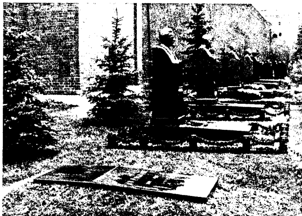
Stalins Grab (ganz vorn) an der Moskauer Kremmlau.

lin lag auf einem Sofa in einem großen Raum, wo ausgedruckte Zeitungsbilder an den Wänden hingen. Er hatte seine Stimme verloren, aber sein Blick war noch klar.