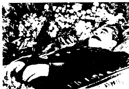
Moskau 1953: Stalin auf der Totenbahre

Swetlana Allilujewa beschreibt die letzten Tage des Diktators