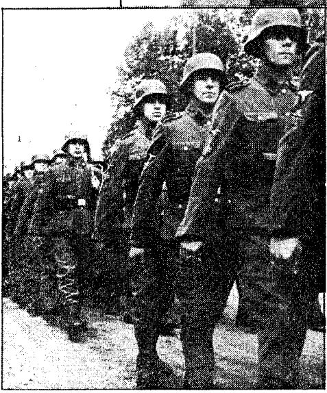
Hjemvendte legionærer på marsj gjennom Oslos gater, 1943.