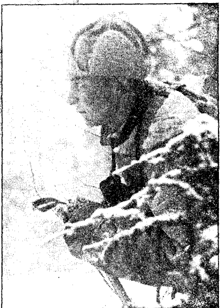
Kulde og branner møtte de norske frontkjemperne i Sovjet.