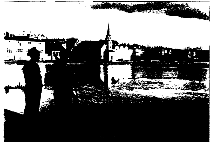
Britische Truppen besetzten Island am 10. Juni 1940

Die ersten amerikanischen Streitkräfte erreichten Island am 7. Juli 1941. Besser als die britischen Truppen mit finanziellen und technischen Mitteln ausgestattet, brachten sie mehr Arbeit ins Land und damit mehr Geld. Darüberhinaus führten sie Ausrüstung wie Planierrau- pen, Krane und Jeeps ein. In Island bis dahin fast unbekannt, wurden diese Geräte bald schon im isländischen Aufbau eingesetzt. Als Konsequenz formte sich bilateraler Handel mit den USA aus.