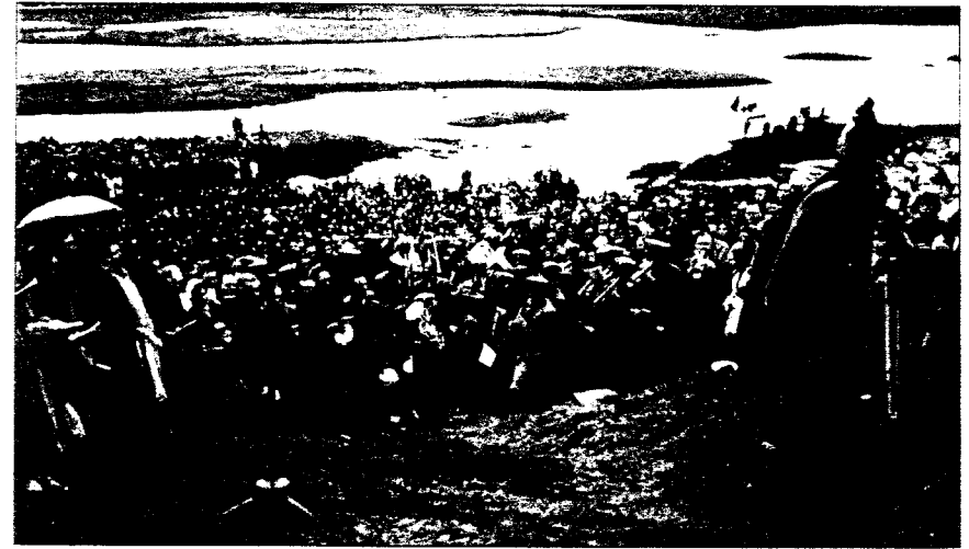
Ausrufung der Republik Island in Thingvellir am 17. Juni 1944.

Sveinn Björnsson Präsident 17. Juni 1944