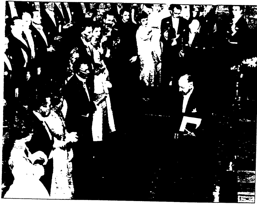
Hallgrímur Laxness rechts nimmt 1955 den Nobelpreis für Literatur entgegen.