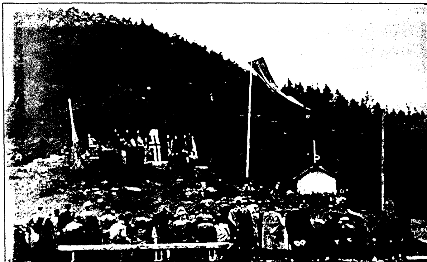
Slik ser staden ut der minnesteinen sto. I dag er det berre nokre restar att, og der er tilvakse med skog. Heimestyрkar frå Sunnmøre fjerna steinen i juni 1945.