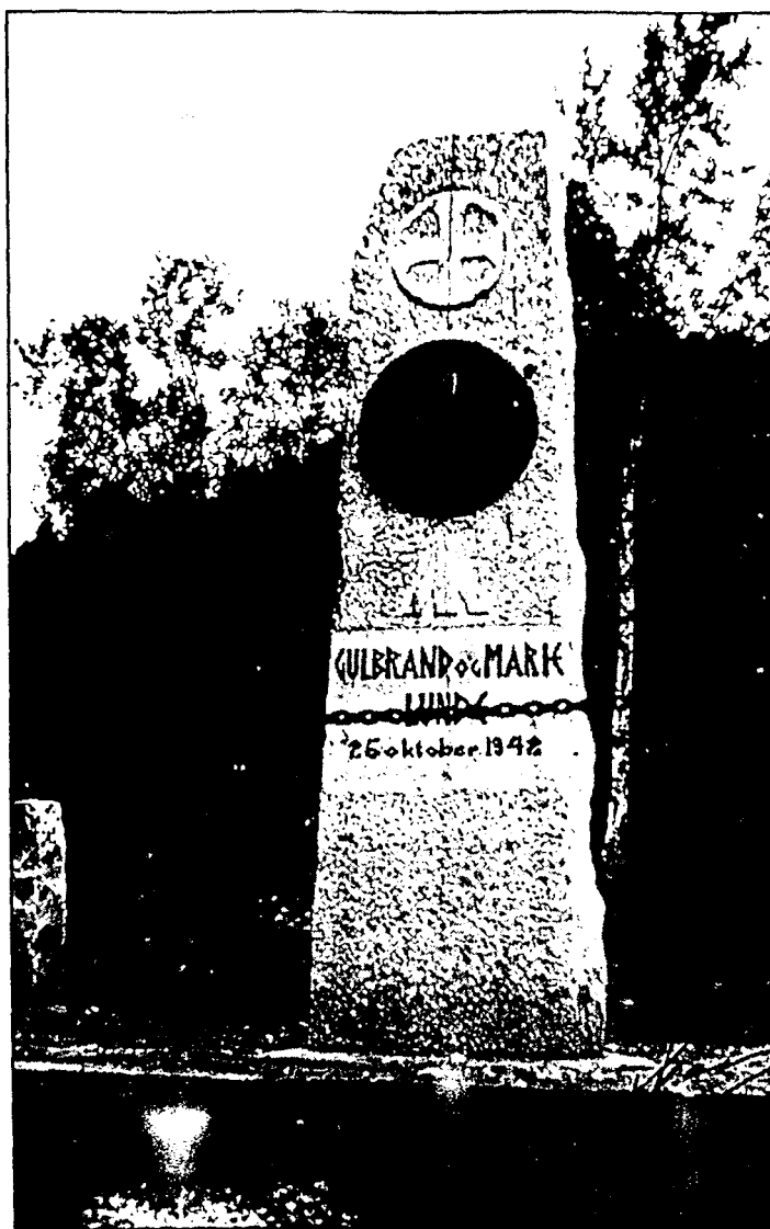
Slik såg minnesteinen ut. Solkorsskjoldet er i dag på Ålesund museum, og det ber tydeleg preg av å vera skote på.

Men historien om ulukka i Romsdal er ikkje over med dette. Det vart bestemt at det skulle setjast opp bauta ved ferjeleiet der Gulbrand og kona