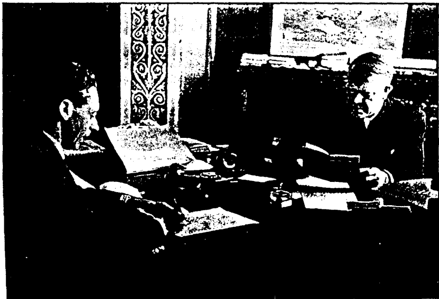
Minister Gulbrand Lunde i audiens hjå føraren Vidkun Quisling på slottet.

Ferjeleiet hadde ferjekai av det gamle slaget med lem som vart heist opp og ned med kjettingar eller wire. Ferja hadde motoren i gang lenge for å pressa