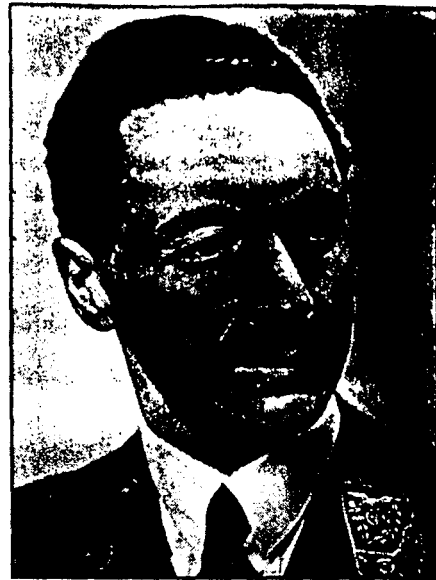
Gulbrand Lunde, statsråd under krigen og med slektsrøter i Vik, omkom 25. oktober 1942. Han vart berre 41 år gamal.