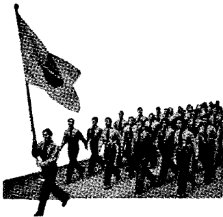
Vær med i F. U. F.

Sommeren er slutt, skolen er begynt — og du selv er så smått begynt å lure på hvordan høsten skal gå.