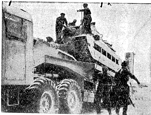
T. v. tank-transport i ökn. En tung brittisk tank lastas av.

hundra år innan han lät sig att samla på jordiskt damm och stoff