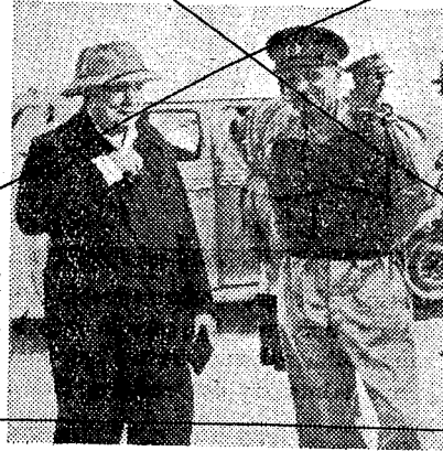
Mr Churchill i ökenkostymering tillsammans med general Montgomery vid besöket i Egypten.