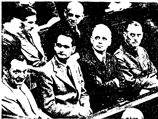
Et stort tilbakeskritt for sivilisasjonen: Seierherrene kriminaliserer den tapende part.

Jackson ble klar over at det var Morgenthau og hans nærmeste stab som hadde planlagt at millioner av tyskere skulle sendes til hardt tvangsarbeide i Sovjet-Russland. Og dette vel å merke uten at de på forhånd var stillet for noen domstol for å påvise eventuell skyld. Den amerikanske krigsminister Henry Stimson var, i likhet med Jackson, helt imot denne uhyrlige plan. Men Roosevelt hadde i Jalta gitt planen sin tilslutning, og da også visse andre ledende kretser gikk inn for den for å få hevn, var det ingen mulighet for