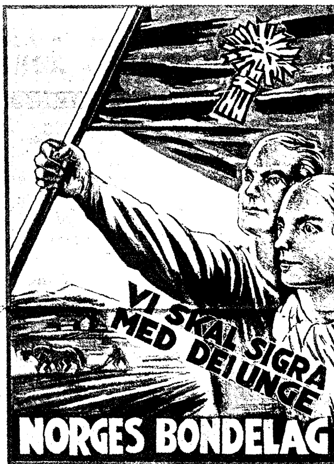
TIDSÅND: Disse to plakatene illustrerer tidsånden der et svært nasjonalromantisk syn på bondenæringen var felles for både Bondelaget og NS. (Illustrasjoner: Bondelagets historie bind 1/Hjemmefrontmuseet)