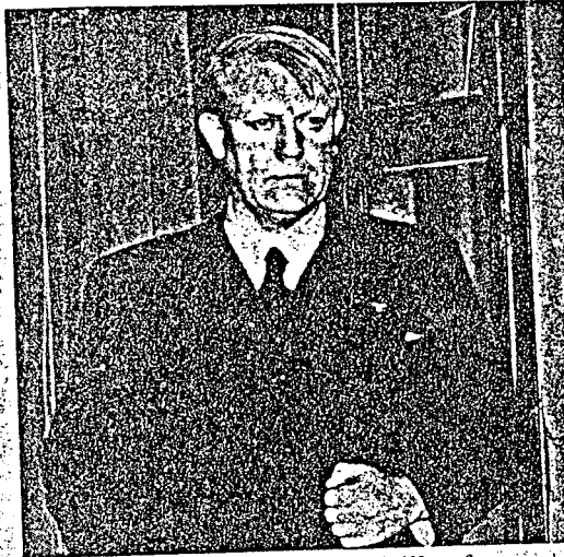
Vidkun Quisling — ville han bare hindre krig i Norge?

Vidkun Quisling var borgaraktivisten borgarskapet måtte forstøyte. Hovedfeilen var aldri hans konkrete handlingar — i ei tid med våpenbruk mot streikande arbeidrar, oppbygging av ei hemmeleg hær reita mot arbeidarklassen, sterke fascistiske og pro-nazistiske haldningar blant «samfundets støtter» var Quisling ein framragande representant for aktivistskiktet. Hovedfeilen var at han aldri makta å mobilisera støtte i folket.