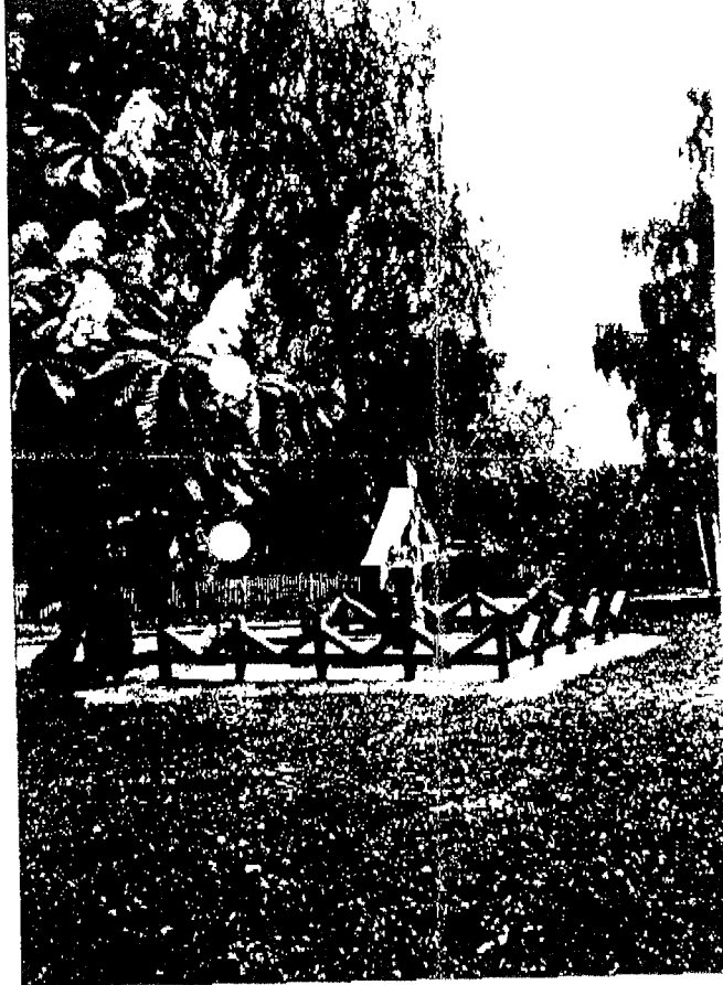
Kreuz mit Rune bei Bitschowa.

schen“ und legten einen Kranz am Denkmal nieder.