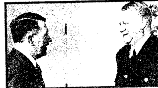
HOS HITLER: Quislings møte med Hitler i 1939 skjerpet den tyske Forerens appetitt på Norge, som kulminerte med det tyske over- fallet på Norge.

I 1945 hadde det norske rettsvesen et presserende behov for å gjennomføre en del straffesaker som kunne gi ret- ningslinjer for den ovrigt rettsprosessen. I Oslo ble stats-