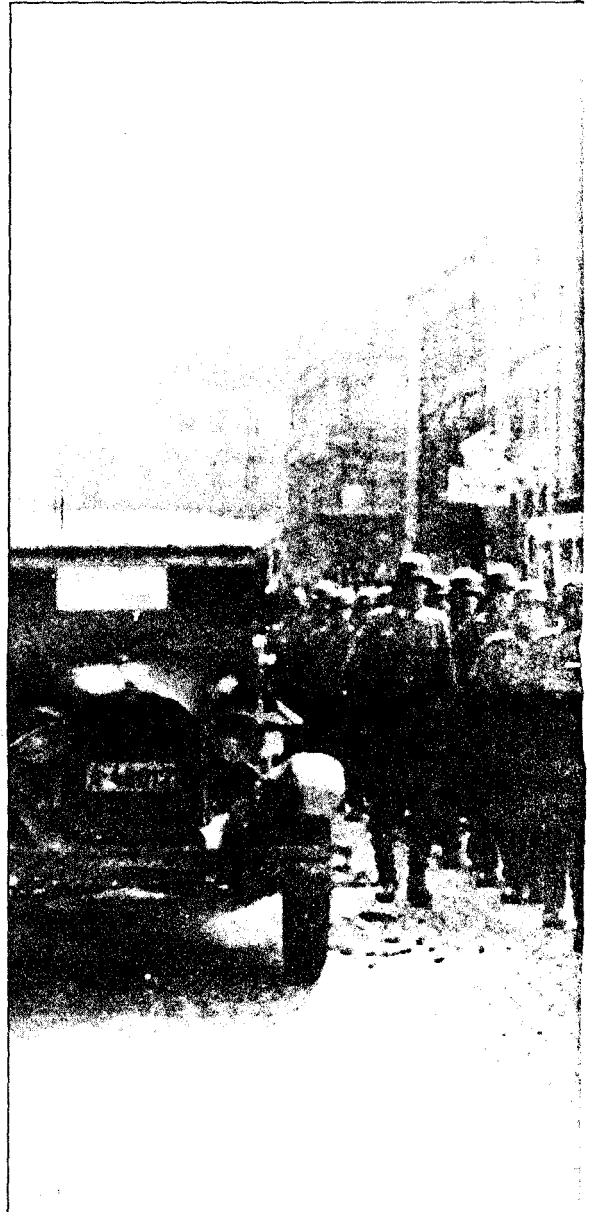
UHNØRET: Tyskerne kunne ta hovedstaden og landet uten veldig stort

Begge vil være til stede på historikermøtet i dag.