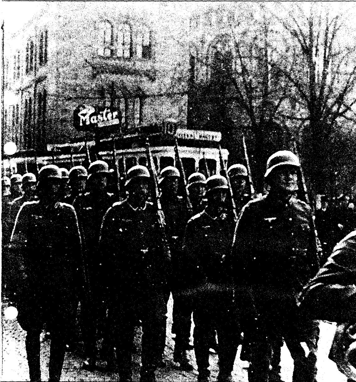
tsstand 9. april 1940. Over 20 prosent av våre offiserer sto i realiteten på fiendens side. Her marsjerer tyske tropper nedover Karl Johan.

I den oppsiktsvekkende forskningsrapporten som legges fram i dag, er det en rekke av våre fremste folk som – det enorme omfanget av NS-tilknytning i offisersgruppa til tross – kommer meget godt fra det kritiske søkelyset. De miljøene som utmerket seg på lojalt vis, er hærens og marinenes flyoffiserer samt marinenes skipsoffiserer.