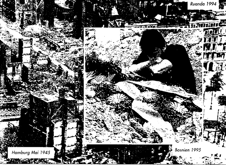
Hamburg Mai 1945