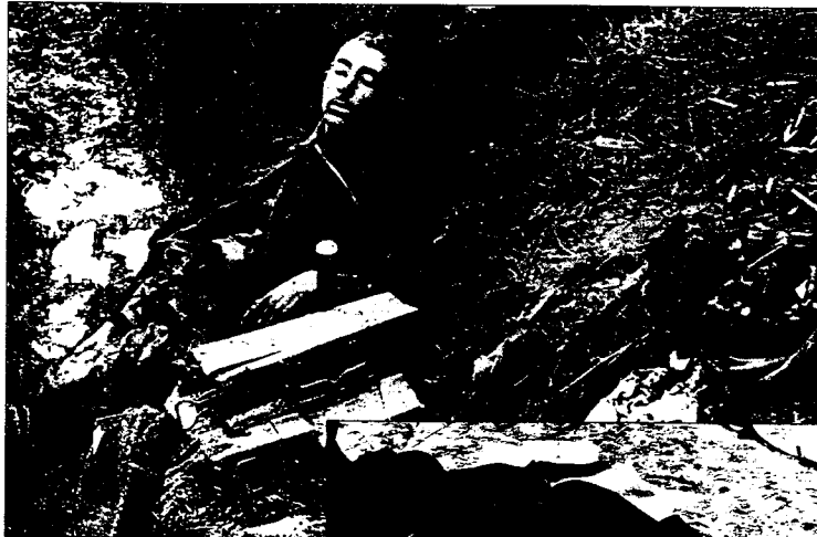
Wie sich die Bilder gleichen:

Ein Jahrhundert der Kriege geht zu Ende. Die Bilanz ist erschreckend und alarmierend: Zwei Weltkriege mit 65 Millionen Toten! Haben sie die Menschheit nicht zur Einsicht gebracht? Kaum ein Tag ohne Krieg, kein Tag ohne Gewalt seit 1945. Erinnerung und Mahnung bleiben bitter nötig. Wir wollen endlich Frieden!