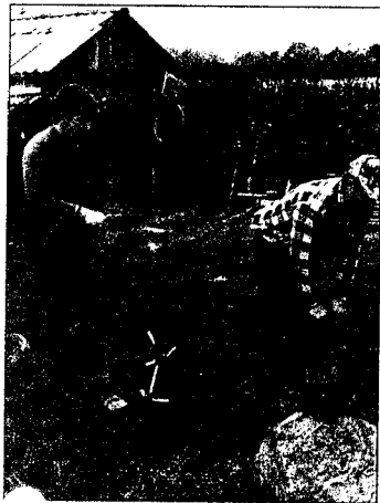
Suche nach Kriegsgräbern in Stepanowo/Rußland (1998)