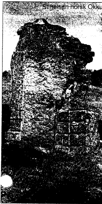
Friedhof Narva/Estland vor dem Bau (1994)

Streifen-norsk Okkupationsgebiet 2004 bergen oder die Friedhöfe würdig ausbauen wird.