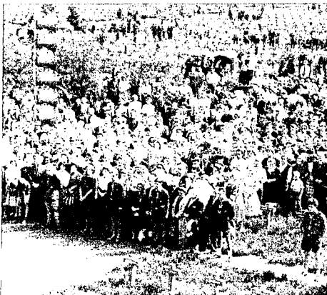
Einweihung des Friedhofs Lommel/Belgien am 6. September 1959

Hinterbliebenen, sondern auch der Erinnerung an die Geschichte und unübersehbare Mahnung zum Frieden an die Menschen aller Generationen aus allen Ländern. Auch die kleineren Friedhöfe im Westen und die neuen Friedhöfe im Osten werden besucht, doch ist es dort zur Zeit unmöglich, die Besucher zu registrieren. Nach Schätzungen des Volksbundes besuchen jährlich über eine Million Menschen die deutschen Kriegsgräberstätten im Ausland. □