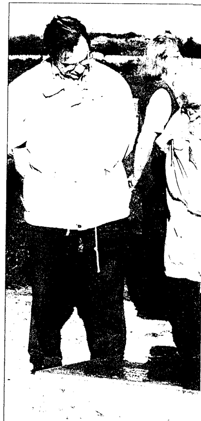
Angehörige auf dem Friedhof Nowgorod/Rußland (1998)

Einschränkungen, mangelhafte Infrastruktur und - im Falle von Rußland und Weißrußland - leider auch wieder politische Hemmnisse erschweren die Arbeit des Volksbundes erheblich. Von den Ländern des ehemaligen jugoslawischen Gesamtstaates sind dem Volksbund zur Zeit nur Slowenien und Kroatien zugänglich. Dazu kommt, daß trotz der außerordentlich erfreulichen Steigerung der Einnahmen des Verbandes durch erhöhte Mitgliedsbeiträge und Spenden das Geld immer noch zu knapp ist, um an vielen Schwerpunkten gleichzeitig schnellere Fortschritte zu erzielen. Der Volksbund hofft, daß die Bundesregierung in den nächsten Jahren ihren Zuschuß (derzeit etwa neun Millionen Mark jährlich) deutlich erhöhen wird. □