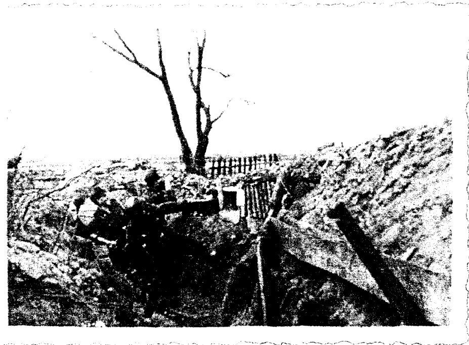
T. Skjæveland og Per Zingstad-Nilsen i skyttergravene. Zingstad Nilsen mistet livet ved Leningrad.

En rad med fem norske gutter i tyske uniformer står og spyr langs veggen til et russisk slott i byen Pusjkin sør for Leningrad. De har nettopp fått vite at kjøttet de kjøpte av en gammel kvinne i går ikke var fra kalv – det var menneskekjøtt.