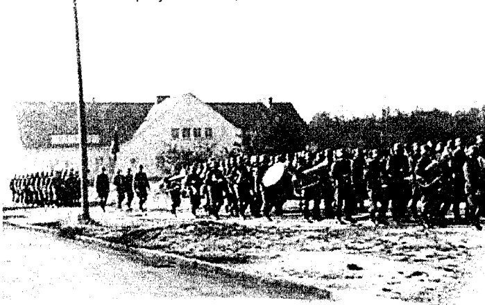
Den Norske Legion i treningsleiren i Fallingbostel i Tyskland.