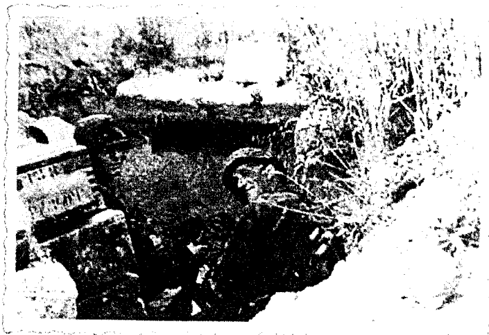
Tre norske soldater med håndgranater.