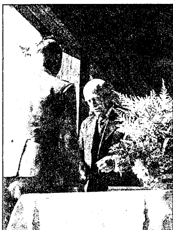
Blant gratulantene: SS-Obergruppenführer Heinrich Fehlis, SIPO- og SD-sjefen som foresto utvekslingen rundt Hamsuns tilliktesett.