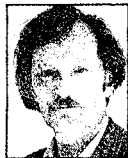
Artikkelforfatteren Odd V. Aspheim er frilansskribent og selv amatørhistoriker.

Men etter å ha drøftet saken med Terboven, ble man enige om å plassere den aldrende asylsøkeren i Reichskommissariatets seilerhytte på Hovik. Der hadde tyskerne også en norsk kokkeansatt, som kunne sørge for den beste forpleining. For sikkerhets skyld ble det også uten Hamsuns vitende – sørget for at tysk politi befant seg i nærheten, blant annet på et par seilbåter like utenfor land. Sjefen for det tyske sikkerhetspolitiet og sikkerhetsbetjenten, SS-Oberführer