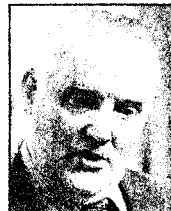
TAUS: Forsvarsminister Dag Jostein Fjærøvoll tar bare imot skriftlige spørsmål knyttet til saken om spiondokumentene som ble kastet.

Ved forsvarsministerens kontor får Dagbladet klar beskjed om at Dag Jostein Fjærøvoll bare tar imot skriftlige spørsmål knyttet til denne saken. Han ønsker ikke å la seg intervjuet om emnet.