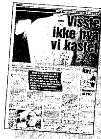
Dagbladet sist onsdag.